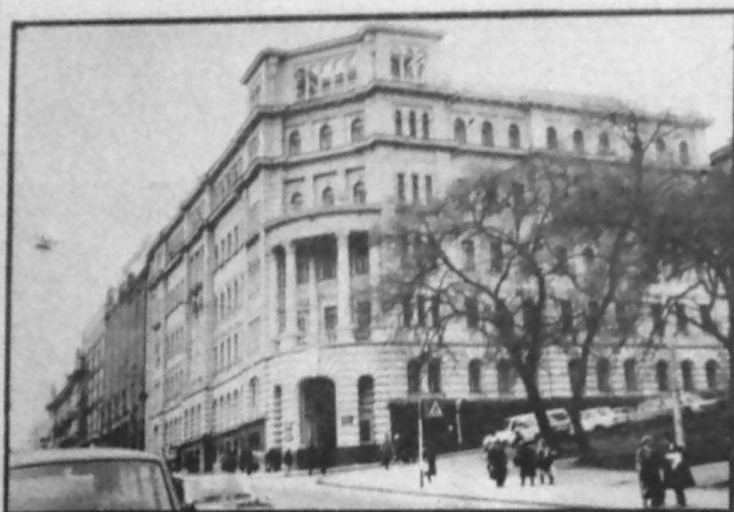
1. Здание на Ленинской, 47, где находился краевой комитет партии, а ныне «держит фронт» крайком ВЛКСМ...

научном и т. д. развитии региона с 1844 по 1939 год. Такого, по мнению специалистов, больше нигде в стране нет. Во время революции и гражданской войны в центральной России были уничтожены многие бесценные реликвии. Нам повезло тогда больше: пожар лихолетья до Приморья докатился позже, интеллигенция сумела спасти многие документы.