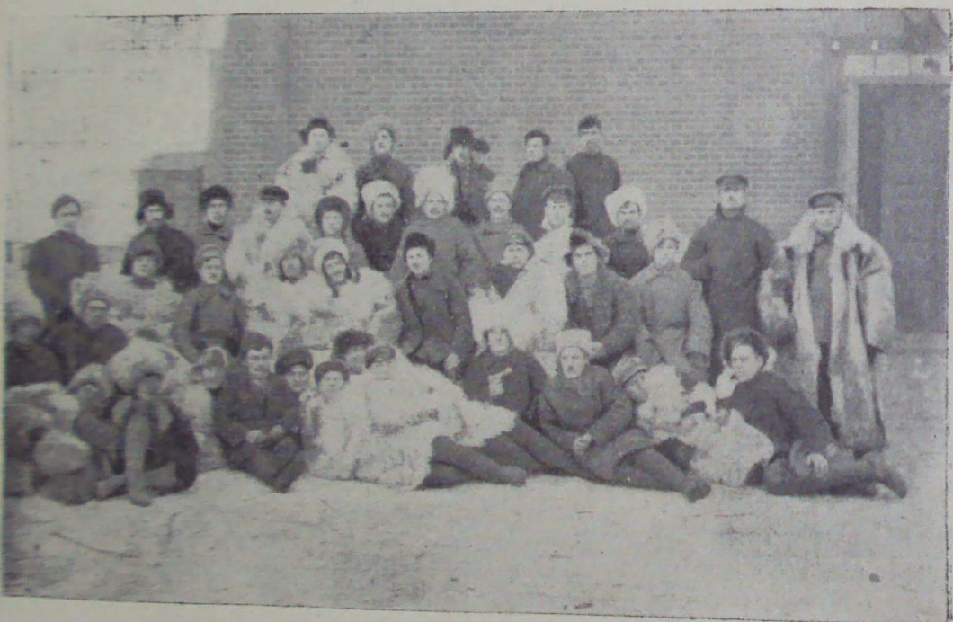
Группа участников партизанского движения в Приморье.

Из всех нас только я один знал дорогу до дер. Бровничи, от которой тайгой тропинка вела в Анучино. К вечеру через овраги и солончак, болота и поля мы добрались до дер. Романовки. Я с одним из товарищей пошел в деревню на разведку и через своих знакомых узнал, что в деревне японцы. Большинство японцев, находившихся в этой деревне, направилось накануне ночью на деревни Речицу и Петровку для поимки красных. За моими товарищами в лесок выехала подвода, чтобы провезти их в деревню незамеченными. В деревне нас основательно подкормили, одного товарища, не имевшего оружия, крестьяне снабдили берданкой. Вечером мы прошли линию железной дороги и направились в дер. Ново-Васильково. Ночь была очень темная, моросил дождь, к концу ночи мы добрались до деревни. На утро мы встретили в этой деревне многих из своих товарищей. Из этой деревни мы направились в дер. Новороссию. От встретившихся нам крестьян мы узнали, что в деревне стоят японцы с полевым орудием и что подозрительных — не крестьян они задерживают. В силу этого нам пришлось обходить через лес деревню и через большие топкие болота и пашни мы к вечеру добрались до д. Ново-Москва. Рано утром нас разбудили