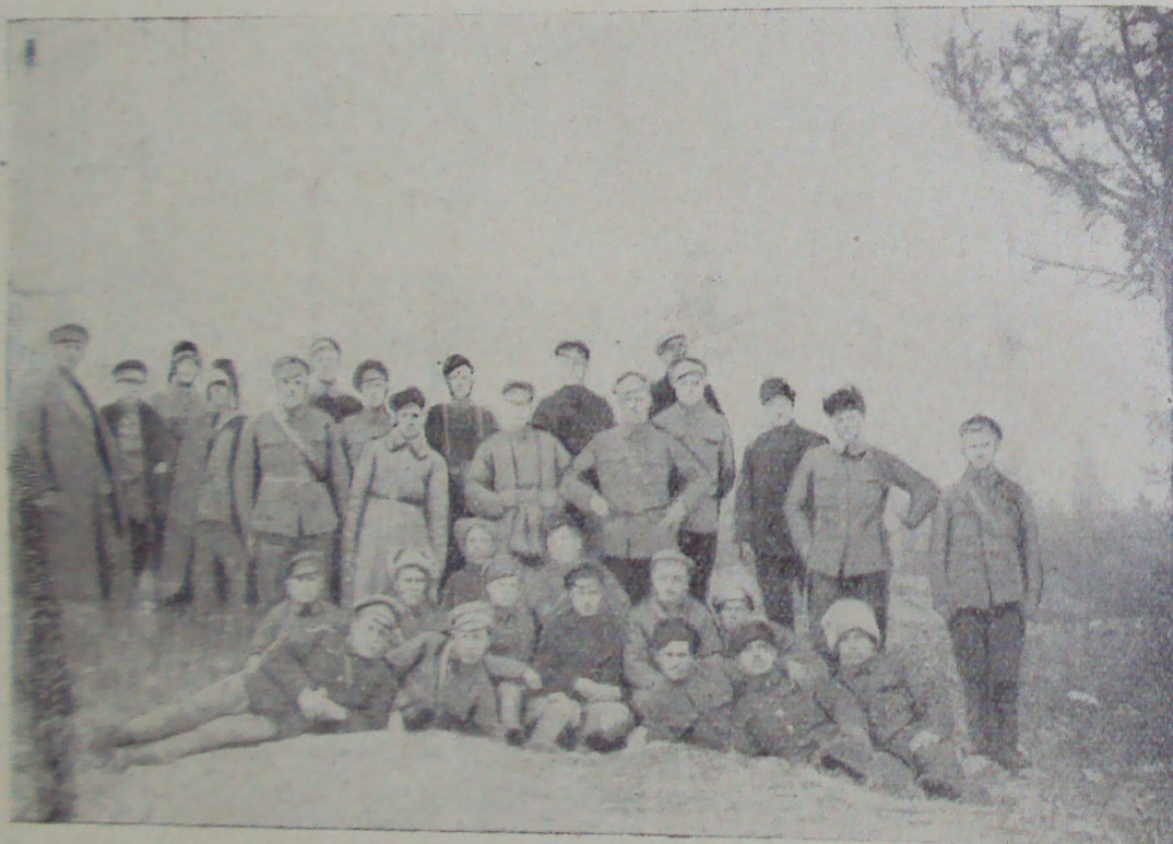
— Группа партизан.

Время шло. Наше партизанское движение крепло и ширилось за счет крестьян и вновь мобилизованных белой «армии спасения» — с полным вооружением переходивших целыми частями к партизанам. Революционное настроение рабочих и крестьян росло, а розановщина готовилась к бегству из Владивостока. Это происходило в декабре 1919 года. И вот, учтя такое положение, японские дипломаты решили заигрывать с рабочими профорганизациями в лице владивостокского центрального бюро профсоюзов. Центральное бюро в это время находилось на нелегальном положении и занимало маленькую комнатку в помещении типографии выше Нардома, на сопке по Нагорной улице, так как с момента чешского переворота 1918 года центральное бюро