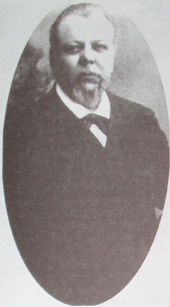
М.Г.Шевелев (1847 – 1903)